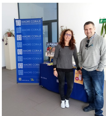
¡A la búsqueda de colaboraciones!

Comenzamos el año activando futuras colaboraciones con diferentes hoteles de Jerez, Bodegas Sánchez Romate y con el nuevo Director de CC Luz Shopping. Precisamente, Luz Shopping, este mes, ha lanzado de nuevo su "Armario Solidario" donándonos la ropa. El CEPER Trece Rosas vuelve a contar con Madre Coraje para su proyecto "Creatas" por lo que hemos estado con su alumnado con charla-tertulia y stand de promoción (foto). También, hemos estado en la reunión del Grupo Motor "Jerez Ciudad por el Comercio Justo", se ha realizado el primer sorteo 2024 de cestas de verduras de nuestros huertos y hemos asistido a la presentación del 75 Aniversario de la Hermandad de la Lanzada, con la cual tenemos prevista colaboración.