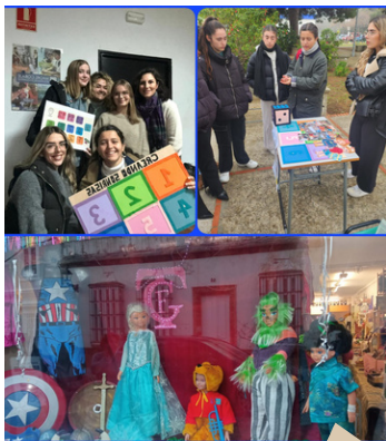
Mercadillos de Navidad y de Carnaval.